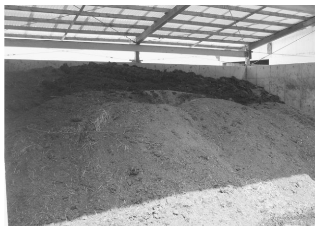
写真6 1/2補助付きリース事業で整備した堆肥舎

生産した堆肥は、全量を圃場散布していますが、せっかく作るなら良い堆肥を作りたいということで、堆肥化に必要な条件や容積重、切り返し回数などを聞いたりしながら、試行錯誤してこられました。