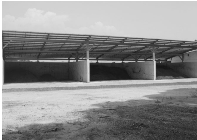
写真5 1/2補助付きリース事業で整備した堆肥舎

を建設することにしました。これまでは、シート被覆して簡易対応してきましたが、周辺への気遣いや、畜舎周辺の環境もきれいにしておきたいという気持ちから、堆肥舎整備を決心し、JAそお鹿児島に相談されたそうです。この年、JAそお鹿児島では5件の肉用牛経営の堆肥舎整備を行っています。