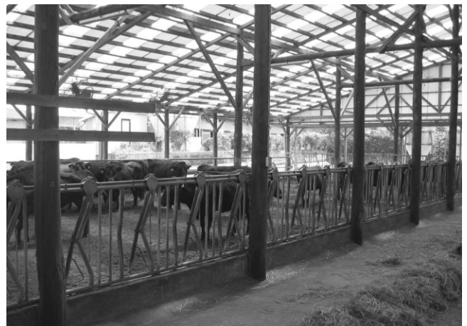
写真2 パドック型畜舎1

これにより、床替えの労力軽減と毎日の床替え作業時間を短縮することができ、牛の管理に向ける時間が増えました。