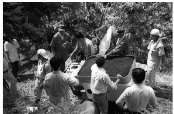
写真2 ペレット堆肥散布機械の作業状況