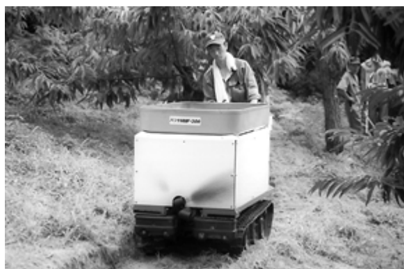
写真1 ペレット堆肥散布機械実演

度:当時)ことが検討課題として残ったが、機械により堆肥散布作業が省力化され、園地へ均一な散布ができることが実証された。