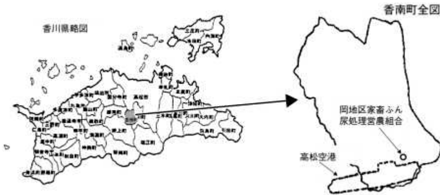
図1 香南可及び組合の位置

そこで、「家畜糞尿処理の適正化」と「良質な堆肥による地域の土づくり」を目的に、岡地区の酪農家11戸が団結して昭和58年に「岡地区家畜糞尿処理営農組合」を設立した。(図1)