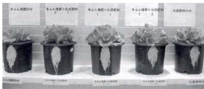
(写真) レタスの生育と根の状況

鉢植栽培試験により窒素の量を合わせて「牛ふん堆肥のみ」、「牛ふん堆肥2+化成肥料1」、「牛ふん堆肥1+化成肥料1」、「牛ふん堆肥1+化成肥料2」、「化成肥料のみ」の試験区を設けて生育、品質を調査した。