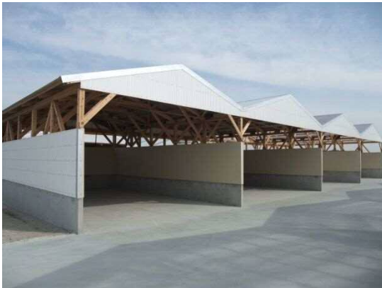
写真2 補助事業で整備した堆肥舎