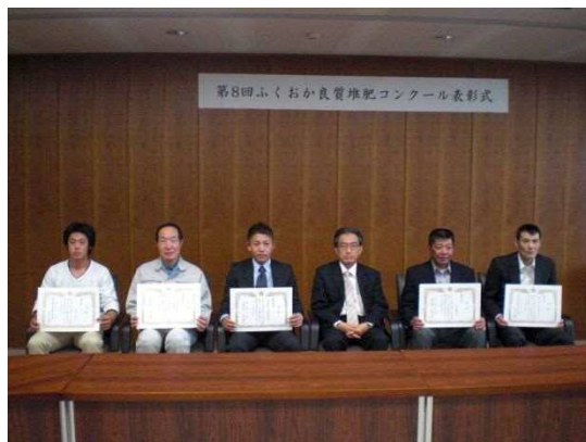
写真1 第8回ふくおか良質堆肥コンクール表彰式

しかし、堆肥生産技術の向上に伴い、特に上位入賞堆肥については、各審査項目が高得点となっており、点数が僅差の堆肥を比較して、優劣をつける意義が希薄になりつつあり、順位を付けるコンクールのあり方については、今後の課題となっています。